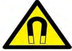
Kuvvetli manyetik alan