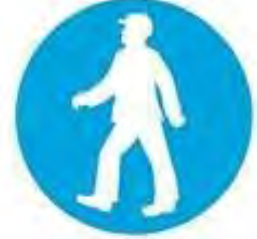
Yaya yolunu kullan