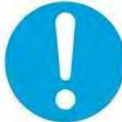
Genel emredici işaret (gerektiğinde başka işaretle birlikte kullanılacaktır)