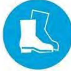
İş ayakkabısı giy