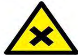
Zararlı veya tahriş edici madde