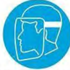
Yüz siperi kullan