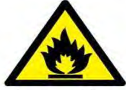
Parlayıcı madde veya yüksek ısı