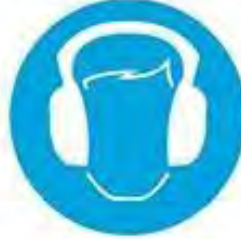
Kulak koruyucu tak