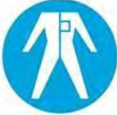
Koruyucu elbise giy