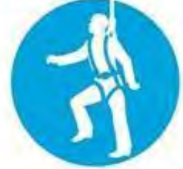
Emniyet kemeri kullan