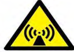
İyonlaştırıcı olmayan radyasyon