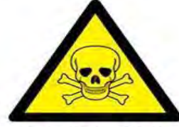
Toksik (Zehirli) madde